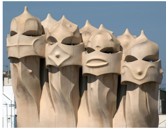
(شكل ٩) بعض فتحات التهوية العلوية والمداخن علي اسطح مبان جاودي حيث الاصرار علي تحيل البنينات المحيطة الي لوحات فنيه دون الاخلال بالجوانب الوظيفيه